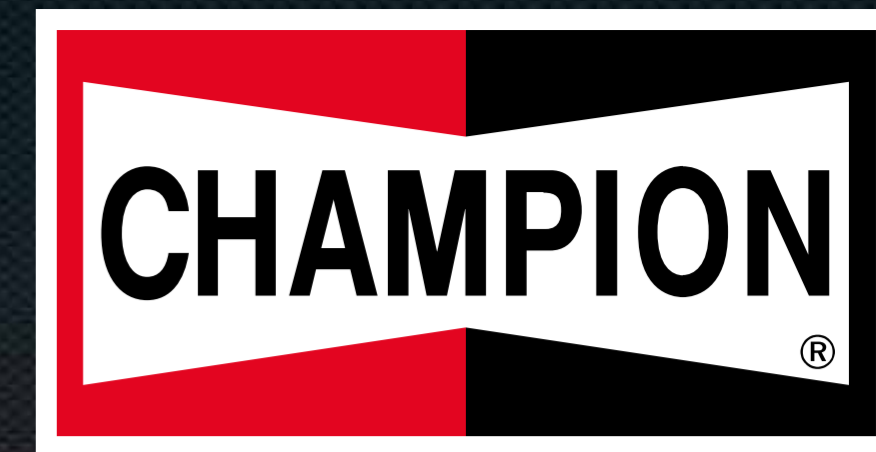
TABELLA DI MONITORAGGIO DEI PROBLEMI DELLE CANDELETTE